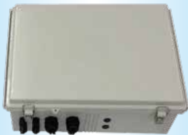
システム本体 (制御ユニット)