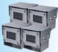
カメラ (最大 4 台)