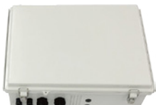
システム本体 (制御ユニット)