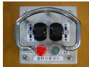
走行操作リモコン

エンジン、電気のどちらでも全て可動します。 エンジンは第3次基準値排出ガス対策型エンジンを搭載しています。