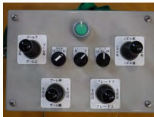
ロボット操作リモコン

既存の運転席を撤去し、作動油タンクや電磁弁類を車体に搭載してコンパクト化しました。 移動用に有線リモコンを採用しています。